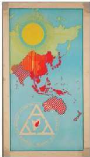
Gambar 3.1. Poster propaganda Jepang

Coba perhatikan poster berikut! Dapatkah kalian menyebutkan wilayah Asia Timur Raya sesuai poster yang dikeluarkan oleh pemerintah Jepang? Tulislah jawaban kalian di buku atau media lain!