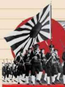
Ambisi Jepang menguasai Asia