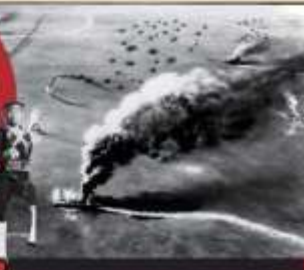
Perang Asia Timur Raya