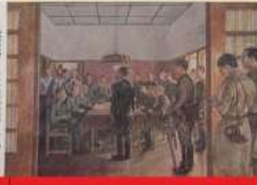
Hindia Belanda jatuh